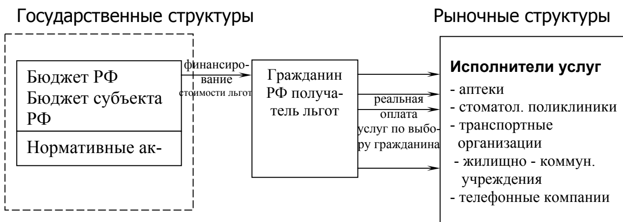
Рис.2. Реализация услуг в рыночных условиях (адресное финансирование гражданина РФ).

При этом ответственность государства за реализацию услуги должна значительно возрастать, хотя участие в самом процессе реализации услуги минимизировано (Рис. 2).